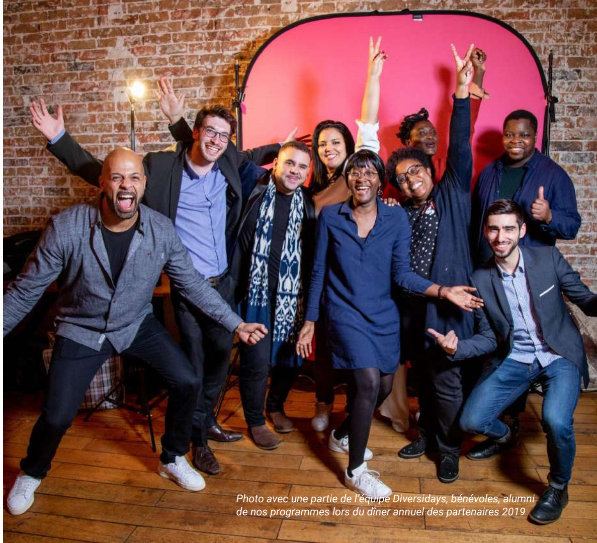
Photo avec une partie de l'équipe Diversidays, bénévoles, alumni de nos programmes lors du dîner annuel des partenaires 2019