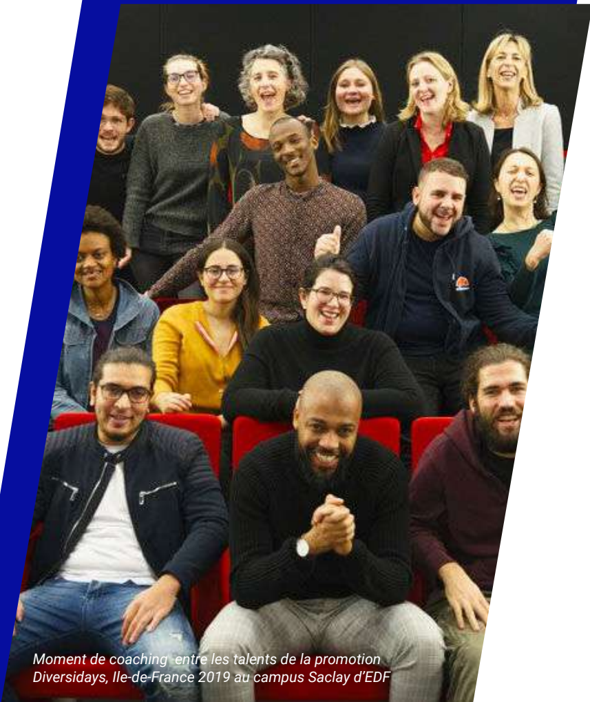
Moment de coaching entre les talents de la promotion Diversidays, Ile-de-France 2019 au campus Saclay d'EDF